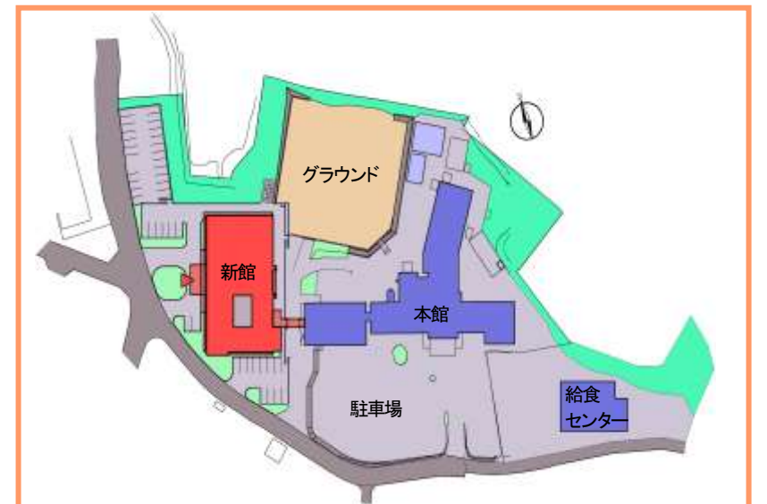
《埼玉森林病院配置図》