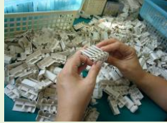
汚れの有無を確認