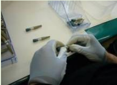
部品を合わせて組立