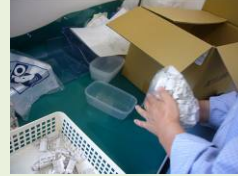
検品後の製品を袋詰め