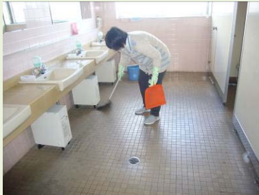
トイレ清掃の様子

平成26年12月より、滑川町の大塚ポリテック株式会社様のご協力をいただき、施設外就労先としてトイレの清掃作業を開始する事となりました。週1回の短時間作業ということもあり、日頃、他の施設外作業に参加していない利用者様も参加しています。この作業は2名の利用者様で行う為、清掃作業にも力が入ります。これからも社員様が安心して気持ちよくご利用していただけるように取り組んで参ります。