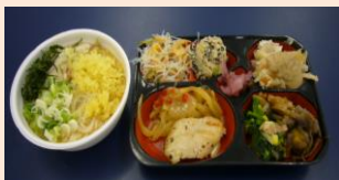
お惣菜とそうめん

夏祭りの最後に3ヶ月間の皆勤賞や特別賞、努力賞の表彰式を行い8名の方が受賞されました。