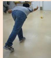
ボーリングの様子