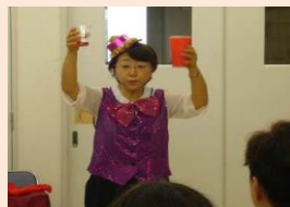
職員のマジックショー