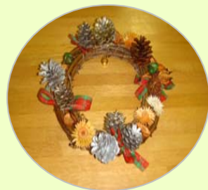
「クリスマスリース」