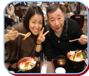
レストランでの外食