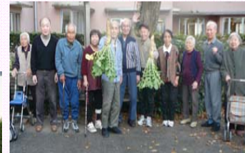
中庭で栽培した大根

12月8日、9日の両日、毎年恒例の忘年会を開きました。芸達者な役者揃いの通所課スタッフが、「島のブルース」「麦畑」「踊るポンポコリン」等の歌と踊りを披露しました。会場は笑いに包まれ、楽しく一年を締めくくりました。