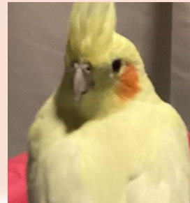
←レモンちゃん ご存じの方もいるかもしれない実は登場2回目レモンちゃんです。可愛い声でお迎えしてくれるアイドルです(^_^)/