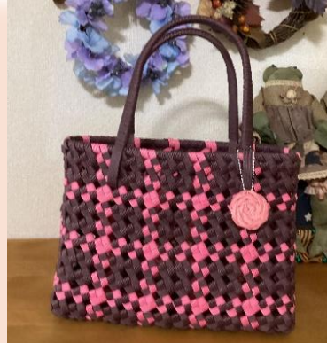
↑ M様作品クラフトバッグです。センス抜群の配色と精巧な作りの素敵な作品です