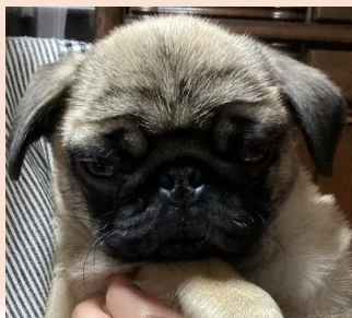
←メメちゃん まだ5ヶ月の可愛い男の子です(^_^) 見ていてるだけでも癒される愛らしさですね！