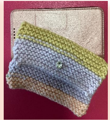
↑ 作品：携帯ポーチ K様より：チャームポイントはキラキラです♡