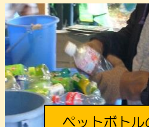
ペットボトルのリサイクル作業