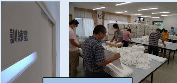
リネンのたたみ作業