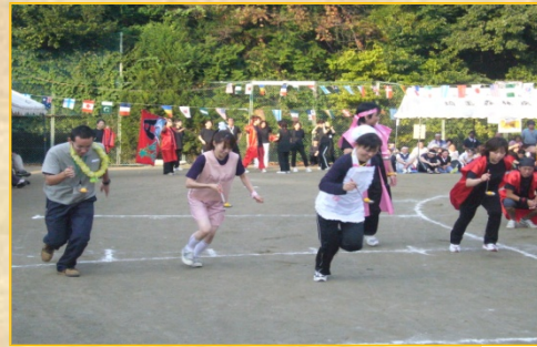
ヨーイドン!! ダッシュ!