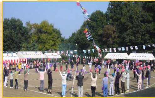
みんなで輪になって楽しくダンス～☆