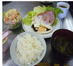
実習で作った料理です！

当院は、高齢者インフルエンザ受託医療機関として予防接種を受け付けております。ご希望の方は、ご来院ください。