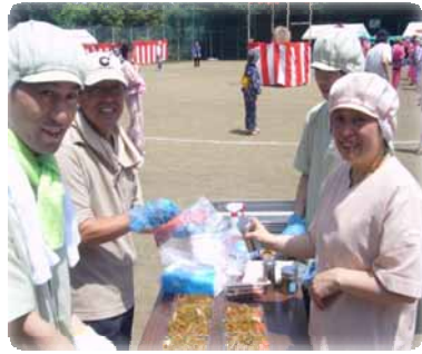
( o )