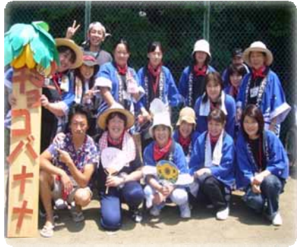
A !! (**^^)v