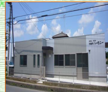
作業所ハーモニー