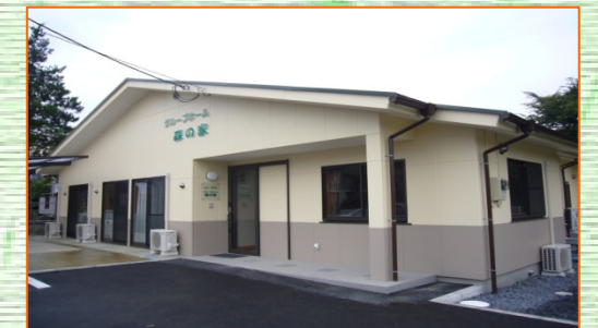
グループホーム外観・内観

9 月 29 日に竣工式を執り行い、10 月 5 日より 体験入所がスタートしました。既に体験入所を終 え、入所された方もいらっしゃいます。