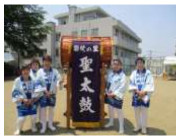
【都幾の里聖太鼓の皆さん】