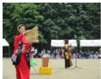
【タナゴ劇団南京玉すだれ】

新緑鮮やかな初夏の日差しの中、多くの患者様に参加をいただき新緑まつりを開催することができました。当日は、「都幾の里聖太鼓」の演奏をかわきりに、「タナゴ劇団」の曲芸にて胸を躍らせ、模擬店からは焼きそば、カキ氷などに舌鼓をうち日々の生活に一服の清涼感を感じてもらえたと思います。