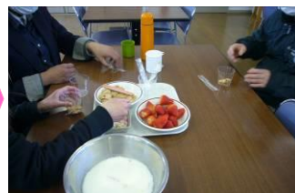
いちごとひなあられのトッピング