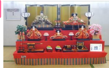
利用者様と職員で飾りました！