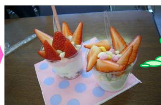
オリジナルヨーグルトパフェの完成！