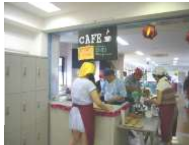
カフェで飲み物を注文