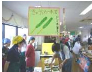
きゅうりの一本漬