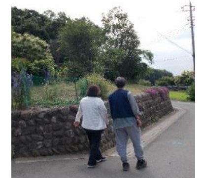
訪問時のお散歩の様子